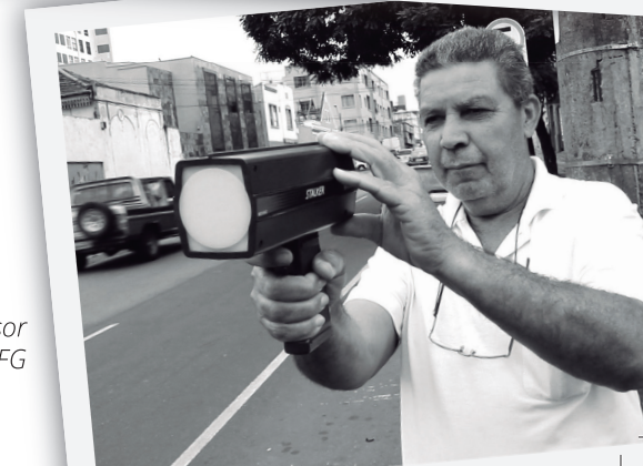
Alunos e professor da EJA do IFG