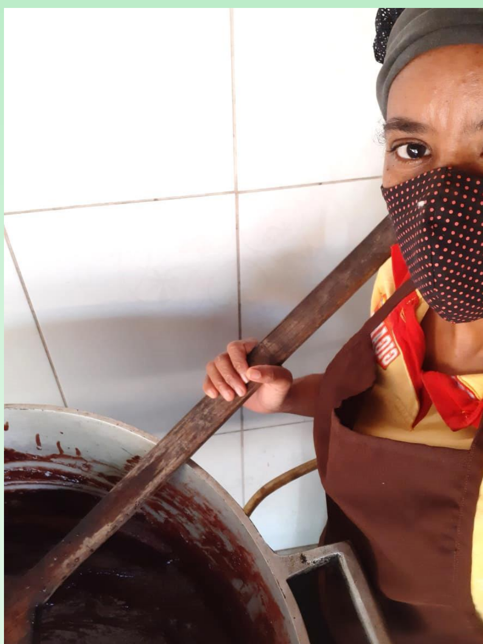
Preparo do Doce