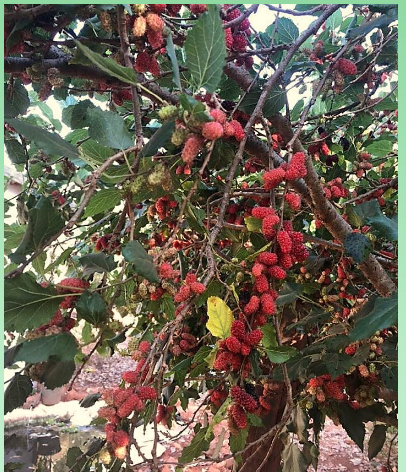
Pé de Amora