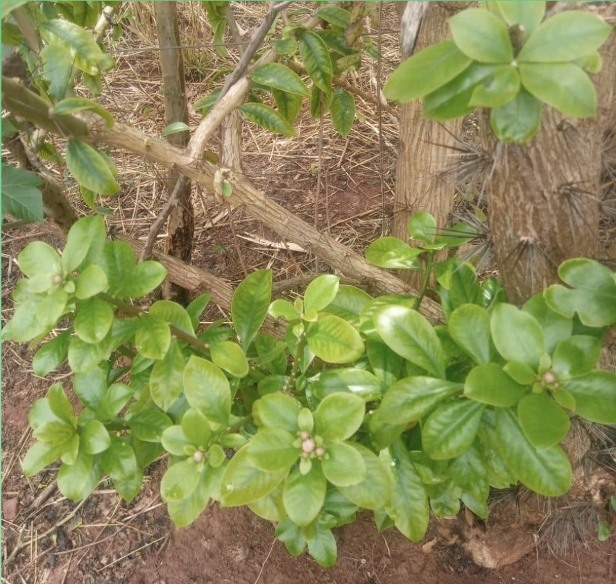
Folhas de Ora-pro-nobis