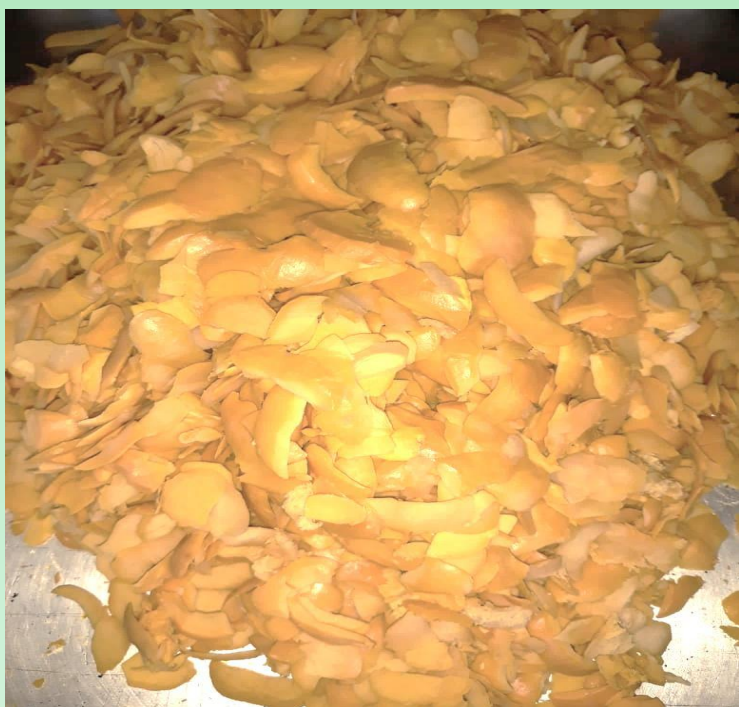
Raspa de Pequi