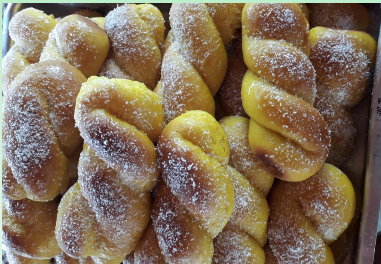
Rosquinha de abóbora com coco.