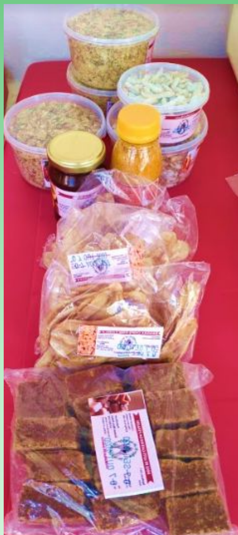
Açafrão, Banana chips, banana desidratada e paçoca de carne.