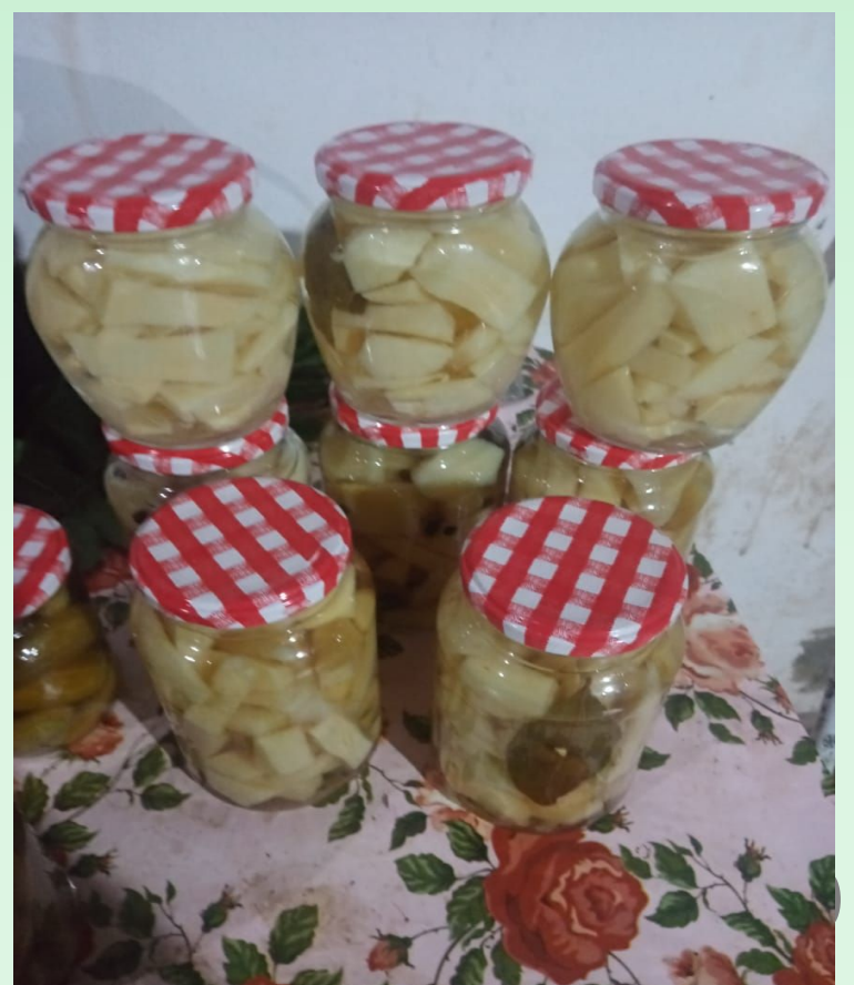
Conserva de Bambu