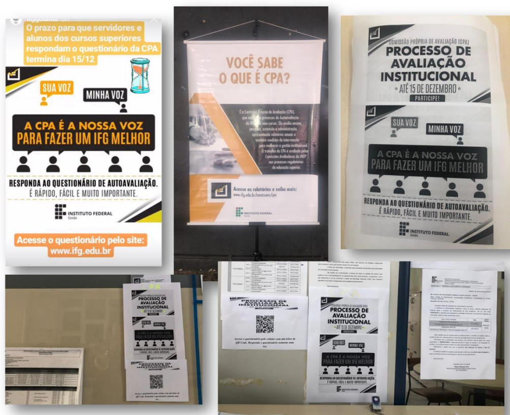
Figura 3 – Amostra da divulgação do Questionário da CPA por meio da fixação de banner e folhetos para divulgação por todo o campus Goiânia.

o acesso ao questionário ao público alvo via smartphones. Adicionalmente, houve a divulgação parcial em sala de aula sobre o que é a CPA e o período para responder o questionário. Por fim, houve um esforço de comunicação pessoal entre os servidores e estudantes para sensibilizá-los da importância do questionário.